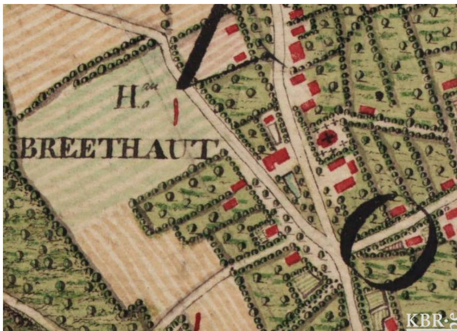
Breedhout, uittreksel uit de Ferrariskaart (1771-1778). De driehoek tussen de huidige Lenniksesteenweg (loopt zuid-noord) en de Smisstraat (loop naar noordwest) is vrijwel zeker een historische dries. De kapel met kerkhof lag aan de noordoosthoek van deze dries.