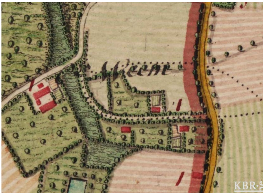
Ferrariskart van het Wedemhof ("Weeme"), met aanduiding van de dreef tussen de Brabantse baan (oranje weg op grens Brabant – Henegouwen) en de Wedemstraat.

Op dit ogenblik loopt er een inventarisatie van de trage wegen onder impuls van de stad, die hierin begeleid wordt door de provincie. Een vijftigtal vrijwilligers zijn op stap gegaan om de huidige toestand van alle trage wegen in kaart en foto te brengen. Deze gegevens worden nu verzameld en de komende maanden komt er een inspraakronde, waarbij over het bestaande en gewenste netwerk van trage wegen met alle betrokkenen, dus ook u, van gedachten zal worden gewisseld. Heel de oefening leidt tot een beleidsplan voor de stad Halle.