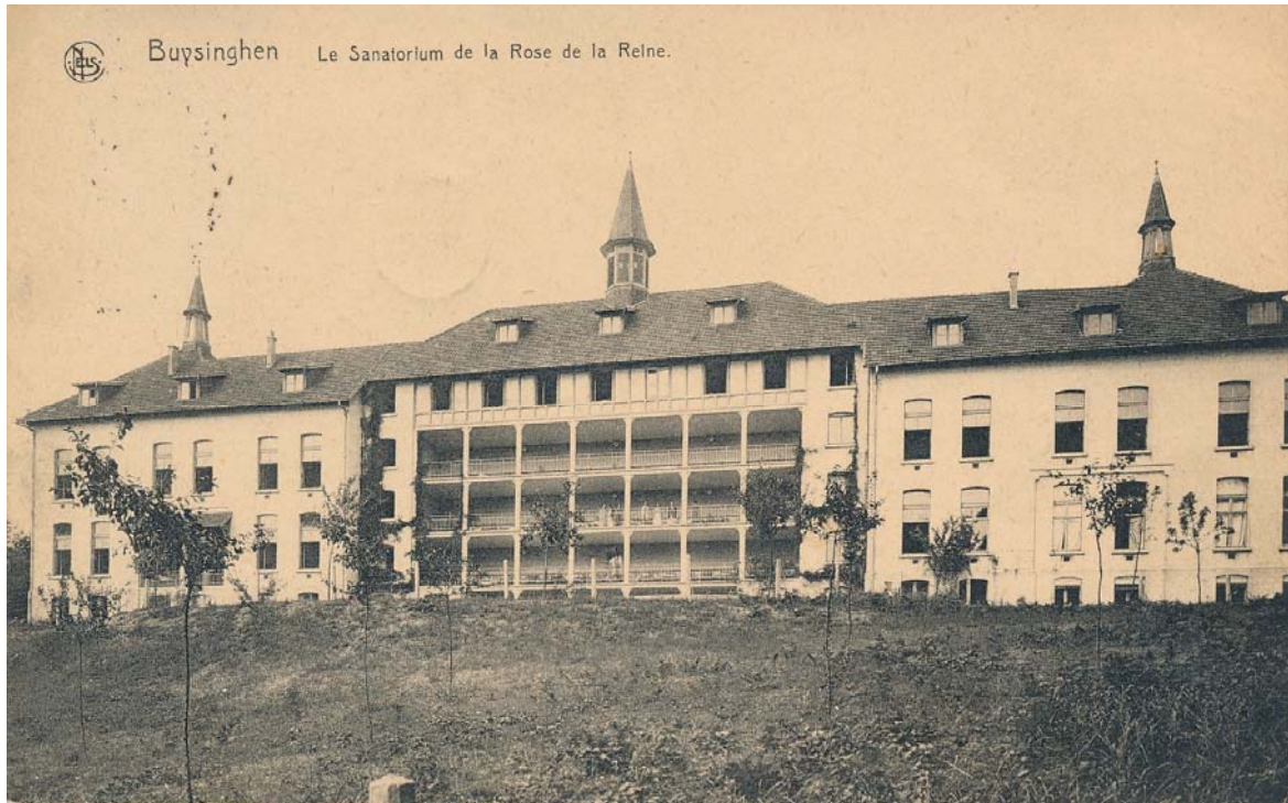
De voorgevel en achtergevel in de begindagen van het sanatorium (collectie G. Lernout).