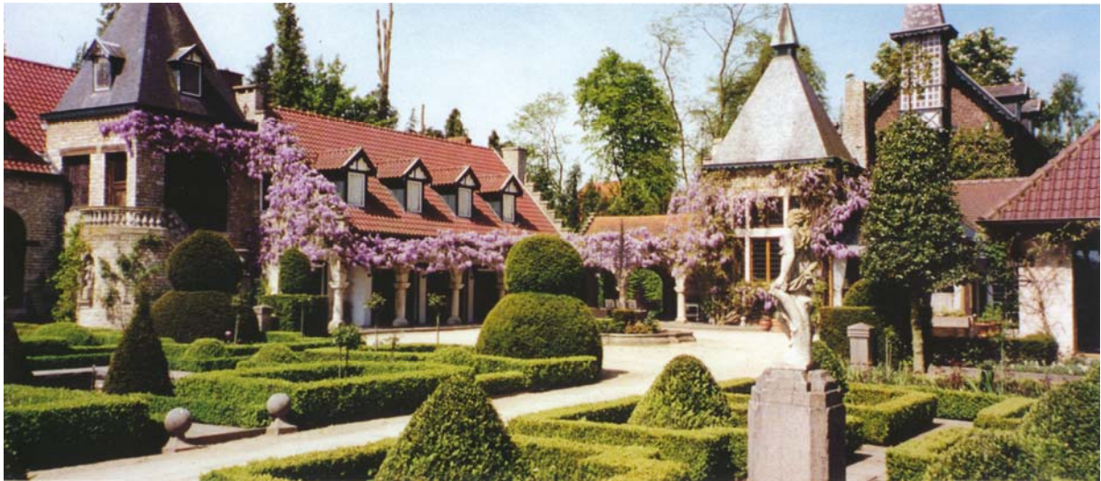
Het Goudkasteeltje en de tuin in zijn gloriejaren, voor 2010.

François Glorieux en Toots Thielemans. Will Tura huwde er in alle discretie in de privékapel op 21 maart 1973 en vierde er zijn trouwfeest.