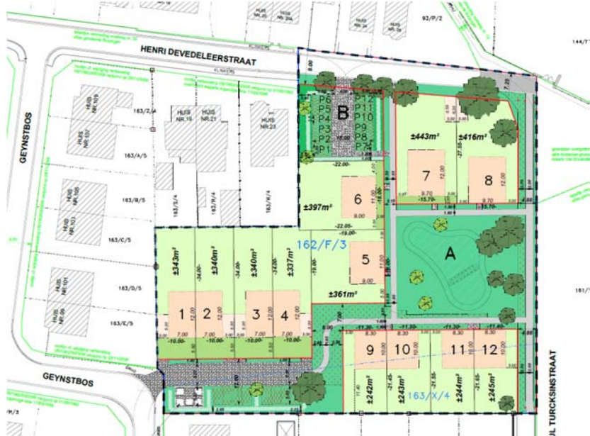
Plan bij aanvraag verkaveling in 2022.