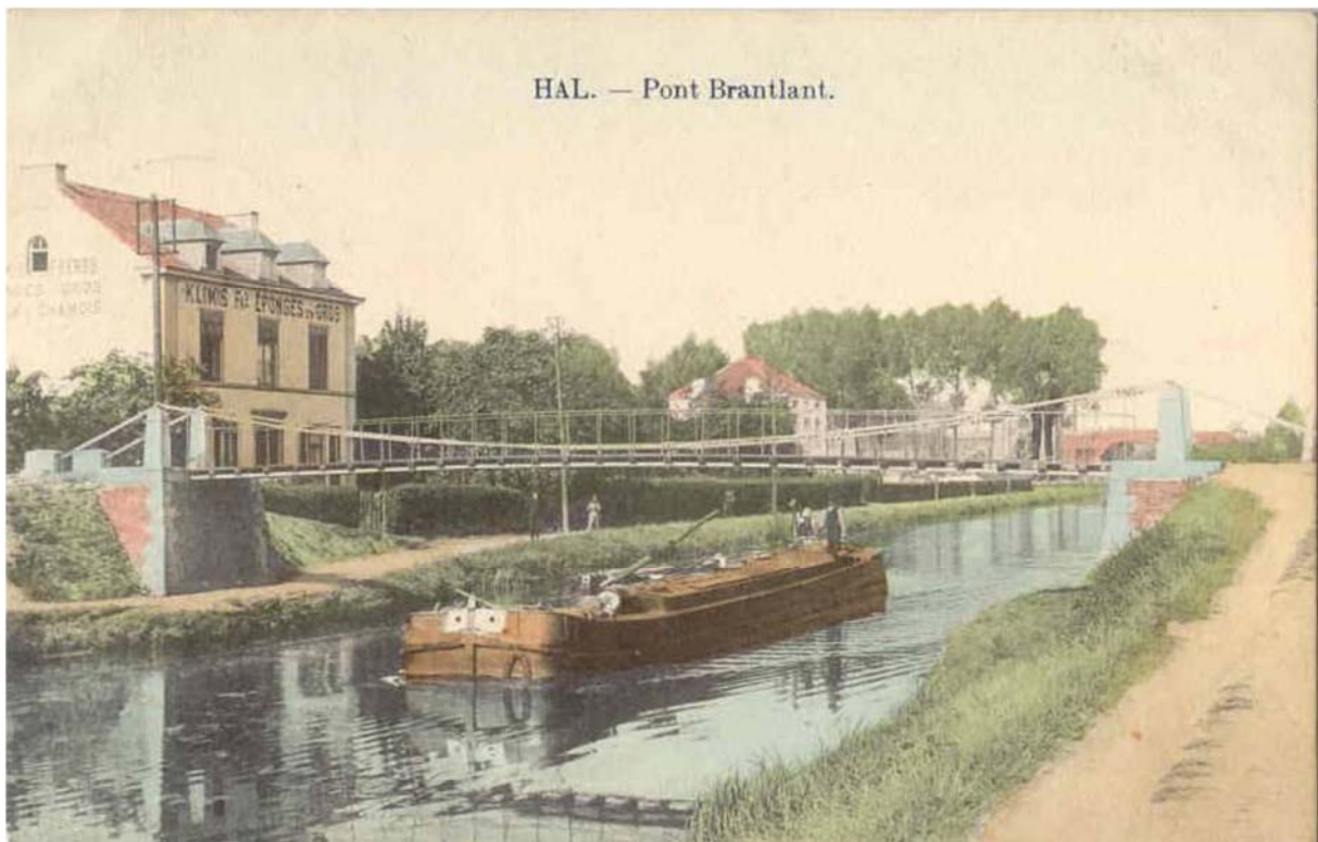
De voorloper van de Klarabrug rond (?)1900: dit was de "Waggelbrug".