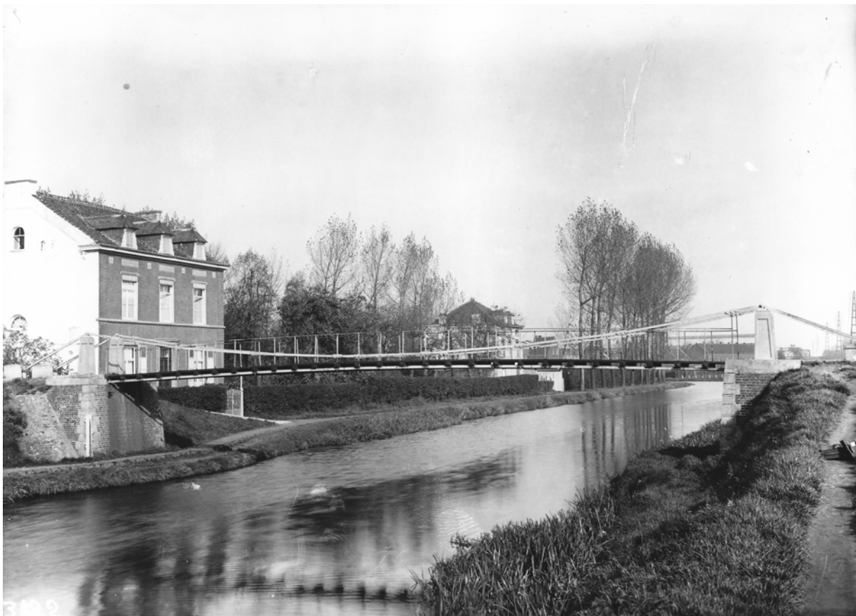
De voorloper van de Klarabrug rond (?)1920: dit was de "Waggelbrug".